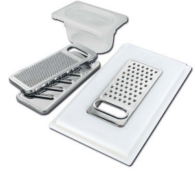
Satz Reibe mit Halterung für Ring und Auffangschale 8159 101 * nur in Kombination mit dem Zubehör 8644 101